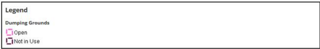
Ffigur: 1 Mannau dypio ar y môr (safleoedd gwaredu) yn Sianel Bryste